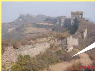
万里の長城未修繕地帯