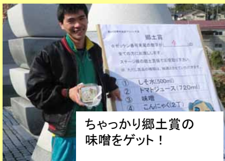
ちやっかり郷土賞の 味噌をゲット！