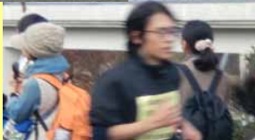
末松 「来年、再チャレンジ」