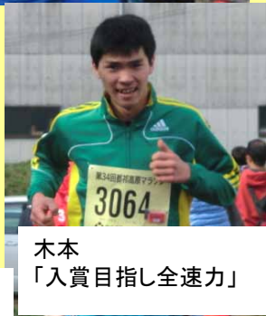
木本 「入賞目指し全速力」