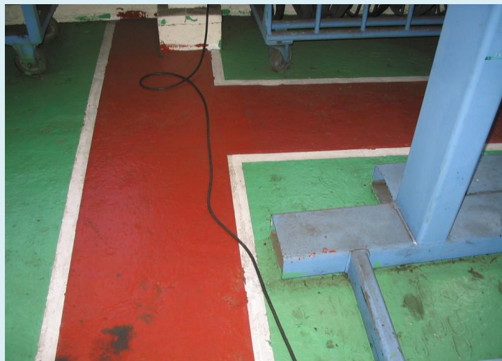
コードの破損、当然発生しますね。