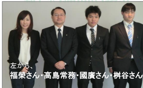
左から、 福榮さん・高島常務・國廣さん・榎谷さん